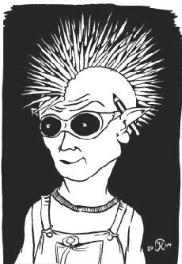
„Pohlád ho,“ našídíl Škemrák...

"Pohláí ho," našídíl Škemrák levicĕ "a□ pocitĕ jeho sílu." Mez ralelnĕ se usmíval.