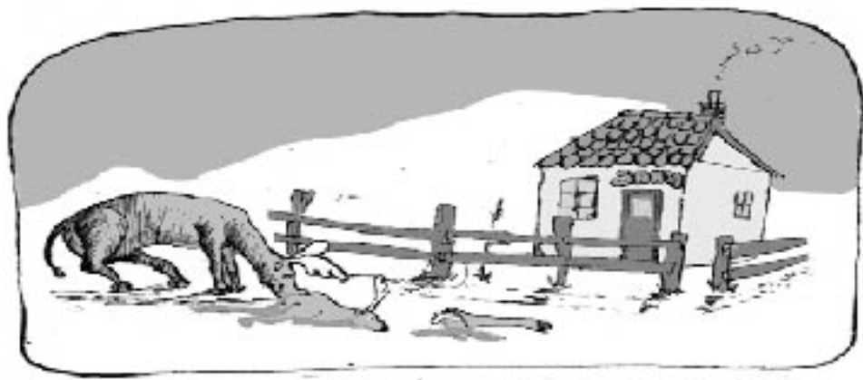
A ŽENKÝ DO ŽEDMONO ROJA