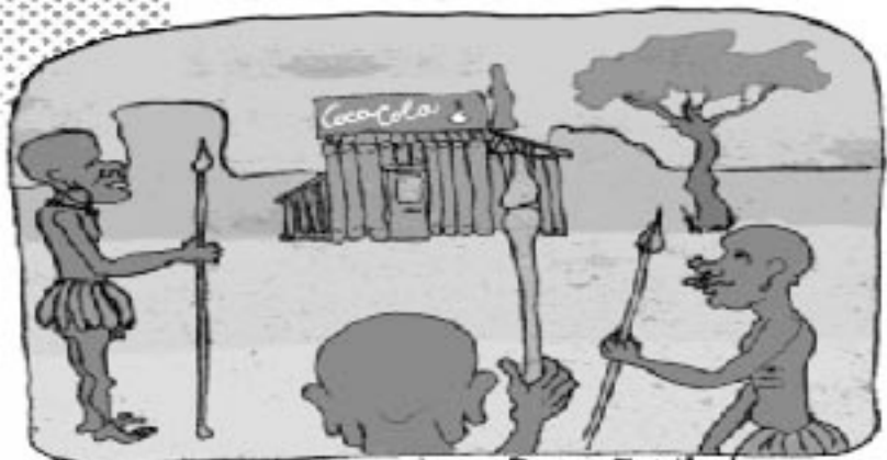
"TAK S TÍM ČLE UŽ MUSÍME NĚKO UDĚLAT, ROZHOVLA SE TEN HATĚTÍ ŠIDANI, KDYŽ XDUŠTIL, ŽE JE TO AMERICKÉ SVINSTVO BOHÁNO AŽ K MŮJ, NA ŽEDICH PALINKATÝ OSTROVĚK..."