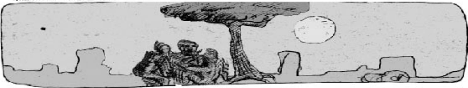
A TAK TANCOVALI A ŽABNOVALI OKOLO OHNĚ 30ky a ...